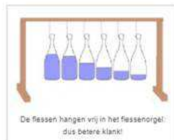
De flessen hangen vrij in het flessenorgel, dus betere klank!

Als je alle flessen hebt gestemd, dan kun je tonen spelen, en dus ook melodieën. Toch klinkt je flessenorgel nog niet zo hard en helder als je gehooft had. Omdat de fles op de tafel staat, wordt een deel van de trilling aan de tafel doorgegeven. Hierdoor trilt de luchtkolom minder hard, en wordt het geluid gedempt. Het is minder helder, minder duidelijk. Daar kun je wat aan doen, door ervoor te zorgen, dat de fles zo min mogelijk andere objecten raakt. Dat kun je bereiken door de fles niet neer te zetten, maar op te hangen. Met enkele latjes maak je een simpele constructie, waar je de flessen met touwtjes aan ophangt. Als je de flessen nu aantikt, zul je merken, dat het geluid veel helderder en duidelijker wordt.